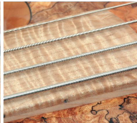
Interessantes Experiment: Ahorn-Griffbrett für einen Fretless

ten Tonhölzern für die Basis und den superedlen, wilden Zierhölzern erscheint auf den ersten Blick merkwürdig, beweist aber letztendlich die Kompetenz des Bassbauers, der eben nicht nur ein schönes Instrument bauen will, sondern auch eines, das gut klingt.