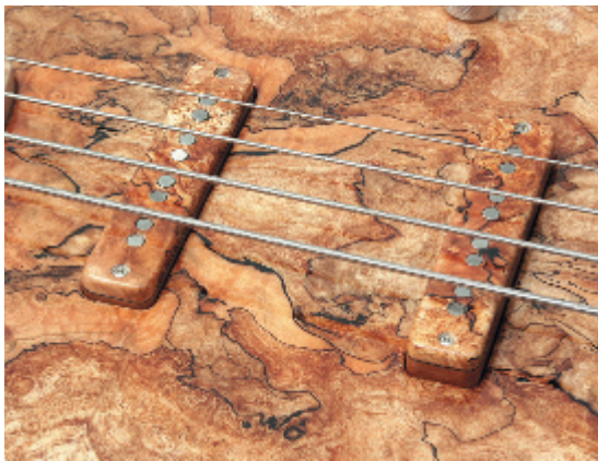
Das Knollenholz zeigt eine sagenhaft wilde und facettenreiche Zeichnung.