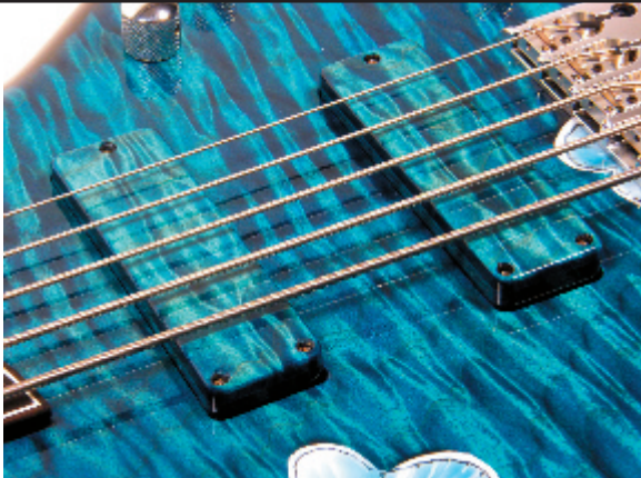
Aus einem Holz: Tonabnehmer-Kappen und Decke