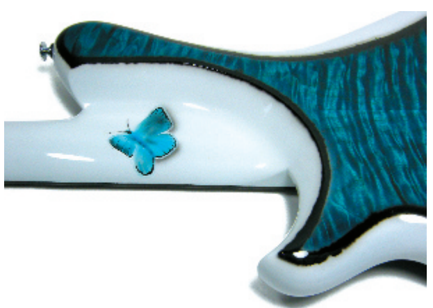
Auch auf der Rückseite flattern die Tierchen.

unwirklich anmutendes Instrument. Eine stetige Überleitung zwischen natürlichen und künstlichen Elementen ist immer präsent und sorgt für eine beständige Inspirationsquelle. Nicht umsonst heißt das Modell Elevation, denn es kann durchaus auch zu einer transzendentalen Erhöhung anregen. De Gier Guitars & Basses, NL-3115 HM Schiedam www.degierguitars.com Preis: ca. € 7500 inkl. Calton Case ■