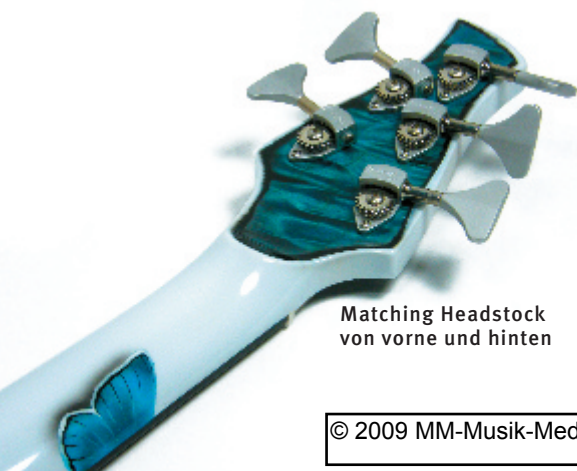
Matching Headstock von vorne und hinten

Was hat dies nun mit einem auf den ersten Blick doch recht konventionellen Musik-instrument zu tun? Sehr viel, denn ebenso wichtig wie die auf höchstem Niveau ver-richtete handwerkliche Ausführung ist bei diesem Fünfseiter die visuelle Gestaltung. Natur als autonome, ursprüngliche Wirklich-keit und Schönheit waren Ausgangspunkt für das künstlerische Finish des Fünfsaiters.