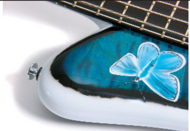
Ist die Quilted-Maple-Decke nun aufgemalt oder echt?

für den Betrachter nicht direkt ersichtlich, auf der Rückseite. Der pure Überfluss! Allerdings steht dies in keinem Widerspruch zu der ursprünglichen Zielsetzung, denn es gibt wohl nichts Verschwenderisches und Opulenteres, gleichzeitig auch oft Uneinsehbareres als die Natur selbst. Hinter dem auf den ersten Blick erstaunlich banalen Bild erschließt sich bei genauerer Betrachtung und Reflexion viel mehr als nur ein hervorragendes, bisweilen sogar